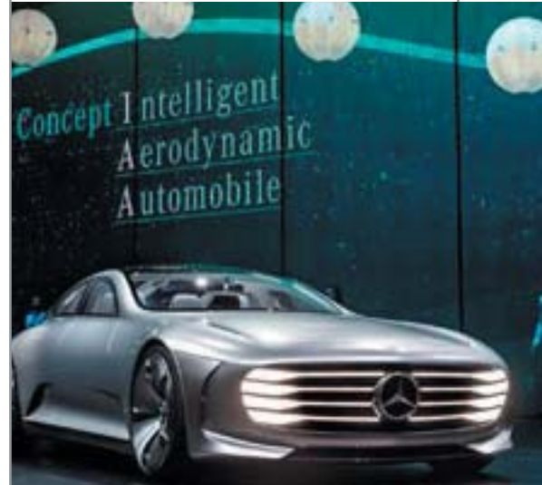
Concept Intelligent Aerodynamic Automobile modeli, dört kapılı coupé görünümündeki iddialı tasarımı ve 0.19 olan Cd değeri ile bir aerodinamik şampiyonu olarak Mercedes-Benz standı Fuarı'nın en çekici modeli idi.

Tasarımı ve dinamik ruhu ile Mercedes-Benz kompakt araç segmentinin ilk ve en çok tercih edilen modellerinden A-Serisi, kullanıcı talepleri doğrultusunda ve gelişmiş konfor sunmak üzere yenilendi. 2012 yılında pazara sunulduğu günden bu yana dinamik bir kullanıcı kitlesi tarafından yoğun ilgi gören Mercedes-Benz A-Serisi, yenilenen versiyonuyla performans kaybı olmaksızın kullanıcının talep ettiği kadar konfor özelliği sunuyor.