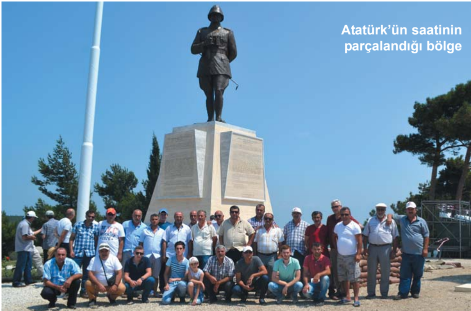
Atatürk'ün saatinin parçalandığı bölge

istilacılara karşı canlarını siper edişlerinin hikayesini dinledik. 5000 şehidin verildiği ama İngilizlere son darbeyi vuran 3. Kitre Savaşı'nda yer