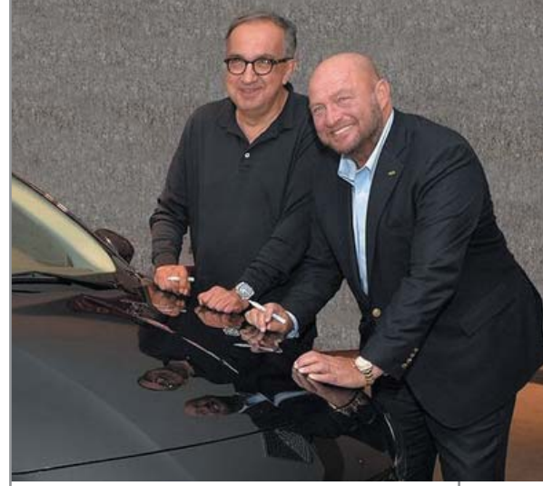
Sergio Marchionne ve TOFAŞ YK Başkanı Mustafa V. Koç, Fiat'ın Bursa'da üretilen yeni sedan modeli Aegea'yı Bursa'da birlikte kullandılar ve bir aracın kaputunu imzaladılar

Bugün ise araç yola çıkmadan Avrupa'dan beklentilerin daha da arttığını görüyoruz. Mevcut gidişat yeni modelin etki alanını daha da genişleyeceğini gösteriyor" açıklamasını yaptı.