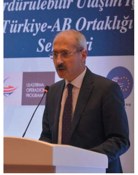
Ulaştırma, Denizcilik ve Haberleşme Bakanı Feridun Bilgin

GAIT 2015 - Sürdürülebilir Ulaşım için Türkiye-AB Ortaklığı Semineri'nde Ulaştırma, Denizcilik ve Haberleşme Bakanı Feridun Bilgin, Avrupa Birliği ile Ulaştırma, Denizcilik ve