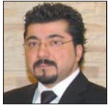
Saner BAYRAM Sayfa 16