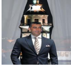
ERKEK GİYİMİN TARİHÇESİ Sayfa 17

33 TÜRKİYE VE AB ARASINDA ULAŞIMDA ORTAKLIK