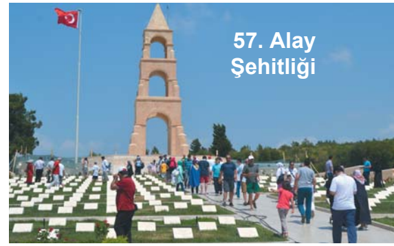
57. Alay Şehitliği

alan askerlerimizin bulunduğu Alçıtepe'deki anıtı ziyaret ettik.