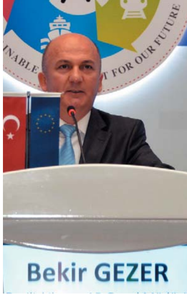
Başkan Yardımcısı Avrupa Birliği Delegasyonu Bela Szombati

Bilgin: "Avrupa Komisyonu'nun 2007 – 2013 dönemi için Türkiye'ye ulaştırma altyapı projelerinde kullanılmak üzere yaklaşık 585 milyon avro hibe nitelikli fon tahsis etti."